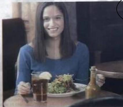
Uleiul de măsline, necesar organismului

» O lingură de ulei adăugată la salată o va face mai gustoasă. Vitaminele vor fi asimilate, iar creierul va putea funcționa mult mai bine. Grăsimile furnizează acizi grași esențiali pe care organismul nu îi poate sintetiza, dar de care are nevoie pentru o întreagă serie de procese.