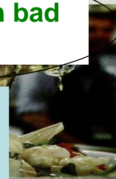
o sursă de grăsimi sănătoase

The good polyunsaturated fats are found in vegetable oils like rapeseed oil, sunflower oil, linseed oil, high quality spreadable margarines, walnuts, pistachio, fatty fish.